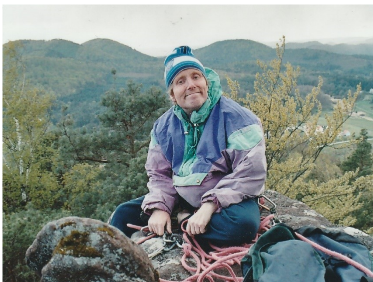
Sur le rocher de la Femme en avril 2006.

Nous adressons nos plus sincères condoléances à sa famille ainsi qu'à ses proches.