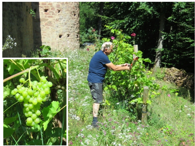
Notre raisin du Schoeneck.