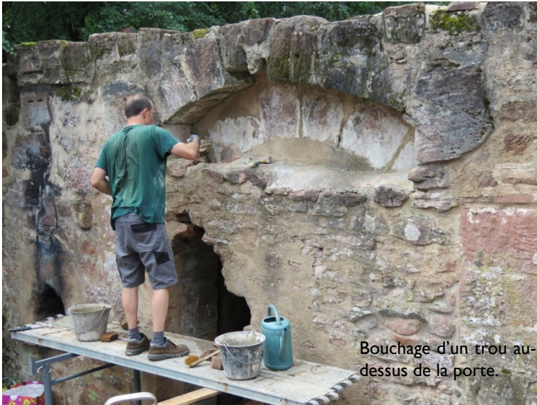
Bouchage d'un trou au-dessus de la porte.

Parallèlement au précédent chantier, nos membres ont été mobilisés par le débroussaillage, par diverses réparations et rénovations, tout en accueillant nos chers visiteurs.