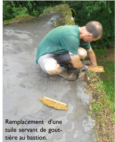
Remplacement d'une tuile servant de gouttière au bastion.