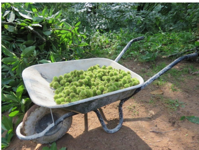
De belles châtaignes.