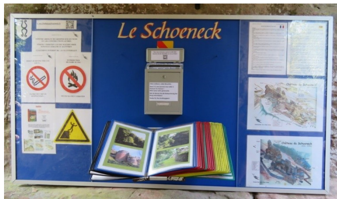
Rénovation de notre panneau d'entrée avec une nouvelle boîte à dons.