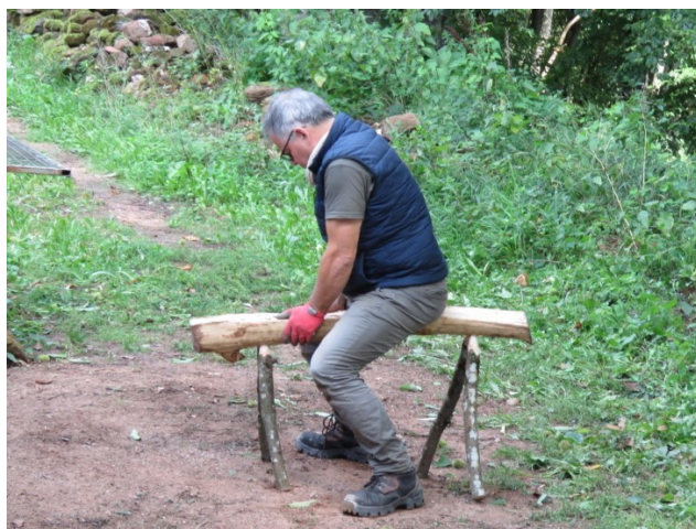
A chaque chevalier son destrier...