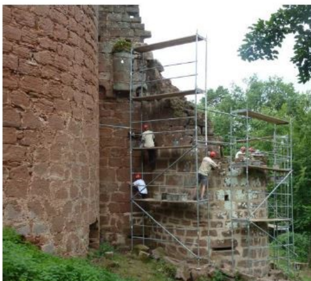
Les travaux de jointolement ont été la principale activité en 2017.

Deux initiatives originales réalisées au courant de l'année dernière sont à souligner : l'organisation d'un concert au milieu des ruines avec l'ensemble Hortus Musicalis au mois d'août et la plantation de pieds de vigne devant les remparts. « Grâce à l'action de tous, les ruines du Schoeneck se transforment peu à peu en un bel endroit, calme et apaisant », a souligné le président. Un endroit devenu incontournable : les bénévoles sont ravis de le faire découvrir aux visiteurs de passage de plus en plus nombreux durant le week-end. L'accès au site est gratuit et