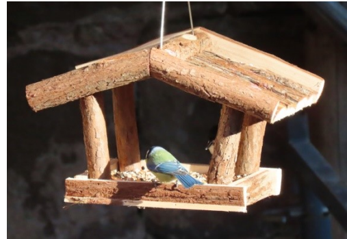
Le beau nichoir rempli de bonnes graines a su conquérir les petits oiseaux.