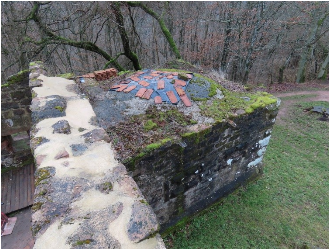
Pose d'une bâche sur le bastion.