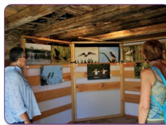
Exposition dans une grange

dambachphotoclub@gmail.com www.clubphotodambach.fr