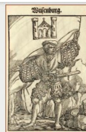
Porte-étendard de Wissembourg (1545)