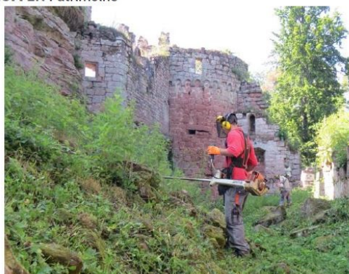
Des jeunes de l'IMPro d'Ingwiller ont débroussaillé les ruines du Schoeneck.

ruines du XII e siècle. À midi quand sonnent au loin les cloches de l'église de Dambach, les pauses sont autant de moments de pur bonheur pour profiter de la beauté des lieux. « Cet endroit est magique », affirme de concert Kewin, Mike et Grégory, tous des spécialistes paysagistes. Ils reviendront certainement dès cet automne pour continuer leur tâche, fiers d'apporter leur contribution à la sauvegarde du patrimoine.