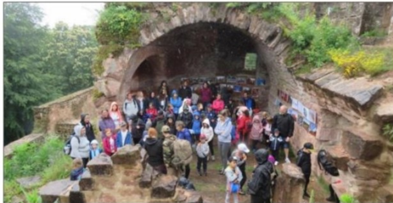
Les écoliers ont trouvé refuge sous la salle voûtée des chevaliers.

Sur le ban communal de Dambach, il ne se trouve pas moins de quatre ruines, le Hohenfels, le Wineck, le Wittschloessel et bien sûr le plus beau, le Schoeneck qui fait l'objet de travaux de restauration par des bénévoles