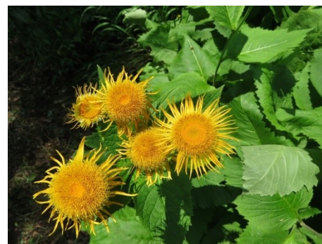
Les inules du Schœneck