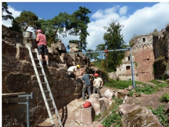
Aujourd'hui, une cinquantaine de personnes travaillent bénévolement à la restauration du château du Schoeneck à Dambach-Wineckerthal (Bas-Rhin).

En 2000, un tailleur de pierre décide de réveiller un château endormi, niché dans les Vosges du Nord. Aujourd'hui, une cinquantaine de bénévoles l'aident dans sa tâche colossale.