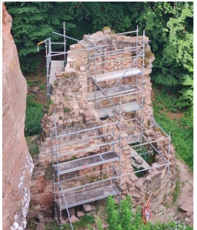
Dessus du mur de la tour.