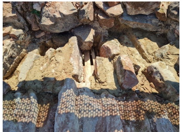
Ci-dessous le dessus de la voûte.