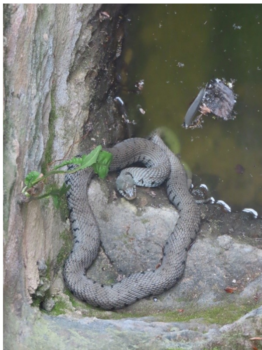
Un visiteur particulier qui sort de son bain.