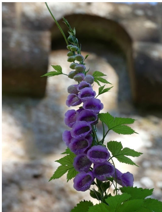
Une digitale à l'ombre de la frise lombarde.