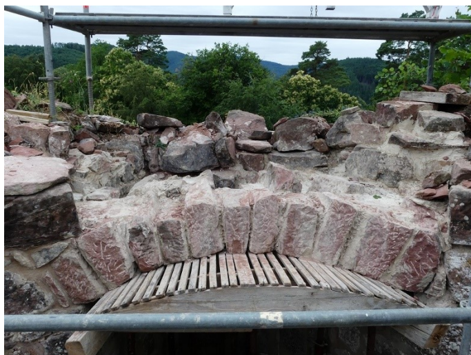
Arc avant de la voûte.