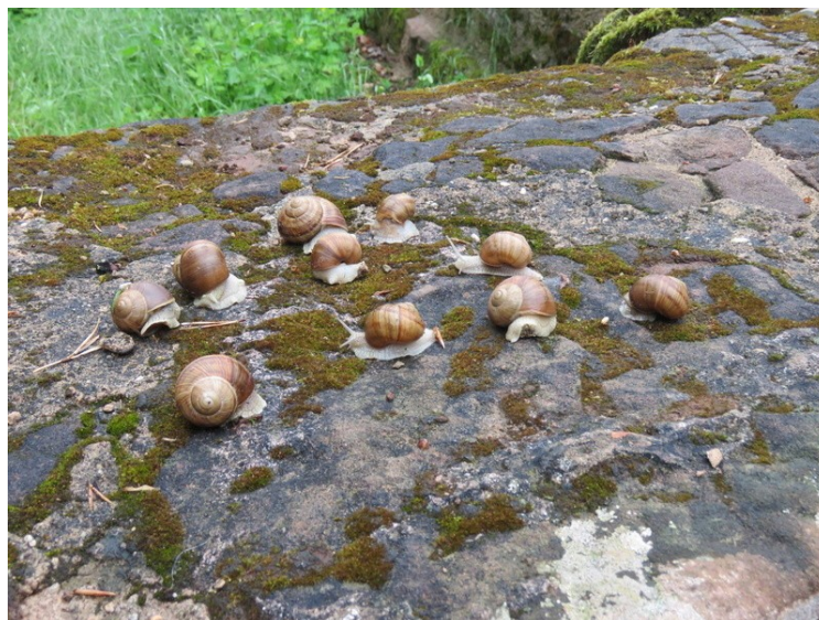
Colonie d'escargots de sortie avec cette pluie ...