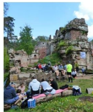
Plus de 200 personnes ont visité les ruines du Schoeneck le 1 er -Mai.

Après le repas de midi partagé autour d'un grill mis à disposition de tous, Jacques, le président, a livré deux belles pierres taillées par un apprenti du lycée de Saverne. Elles seront prochainement installées dans la salle voûtée au milieu du châ-