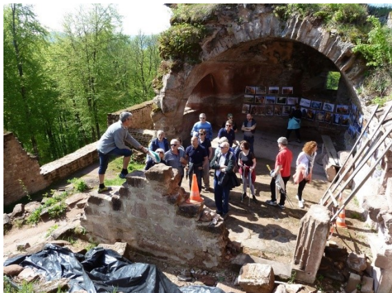
Les visites guidées se sont succédées.