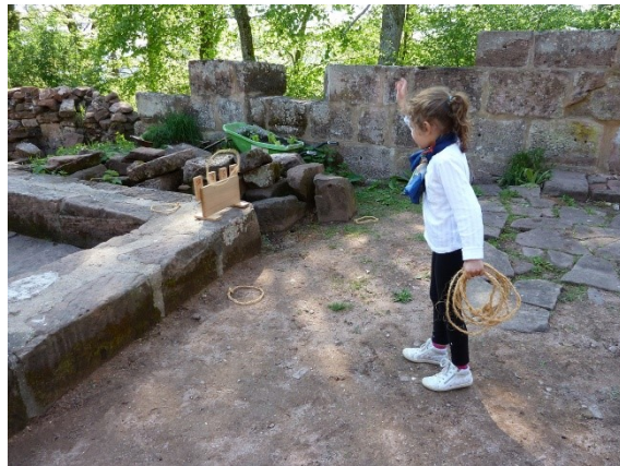
Petits et grands ont pu exercer leur habileté au lancer de cordes.