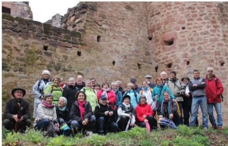
Une délégation du « Weltladen » de Bruchsal (Allemagne) accompagnait les bénévoles de la Boutique du Monde de Haguenau.

Les produits, les nouveautés, les coopératives de producteurs étaient au cœur de la plupart des discussions entre ces militants pour un commerce respectueux du producteur, une juste rémuné-