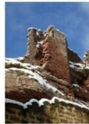
Le pan de mur du logis nord avant sa restauration (à gauche) et après sa restauration qui a demandé trois mois de travail à trois tailleurs de pierre.

Le financement a été assuré grâce à une souscription lancée par l'association (10 000 €) ainsi que des subventions de la Région (24 000 €), du Département (40 000 €), de la Direction régionale des affaires culturelles