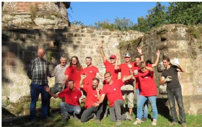
Des salariés de Lilly France à pied d'œuvre au Schoeneck.