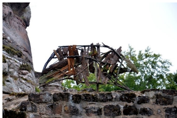
Admirez ce sanglier !!