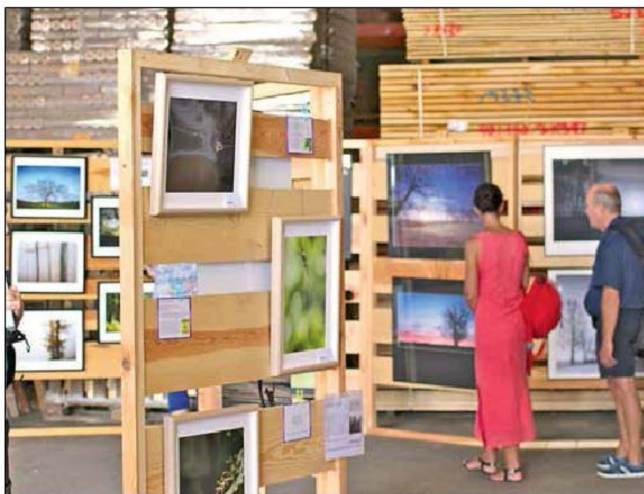
Des photos de nature dans des lieux insolites... à voir absolument.

Dans le Parc Régional des Vosges du Nord, un cadre (photo!) exceptionnel et à nul autre pareil, les photos seront à l'honneur à l'occasion de la 8 e édition des Photo'folies. La nature préservée, sa faune et sa flore serviront de fil rouge à l'ensemble de l'exposition, disséminée dans tous les coins et recoins du charmant village. L'an passé, près d'un millier de visiteurs était venu découvrir les images de nature, d'architecture ou de pays divers, se dévoilant au fil d'une agréable balade dans ce joli village blotti dans une vallée vosgienne. Dimanche, le circuit de découverte passera par une scierie, l'école, une chapelle et les cours ou granges des habitants. Un circuit sécurisé pour les promeneurs et visiteurs. Les photographes y attendront le public pour expliquer leurs techniques et partager leur passion. Les membres du Club Photo de Dambach exposeront collectivement sous le thème « Arbres et forêts ». Des photos tirées sur bâches seront disposées le