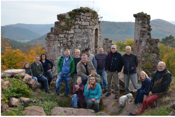
les amis du château de Blankenhorn

Les marcheurs de « Unser Land » sont passés pendant leur périple à la découverte du patrimoine alsacien.