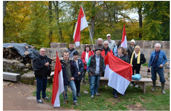
Les anciens de l'association en visite, n'hésitent pas non plus à lever le coude à notre santé.

Les marcheurs de « Unser Land » sont passés pendant leur périple à la découverte du patrimoine alsacien.