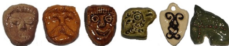
Le sage Le comte Le fou L'agneau Le blason Le cheval