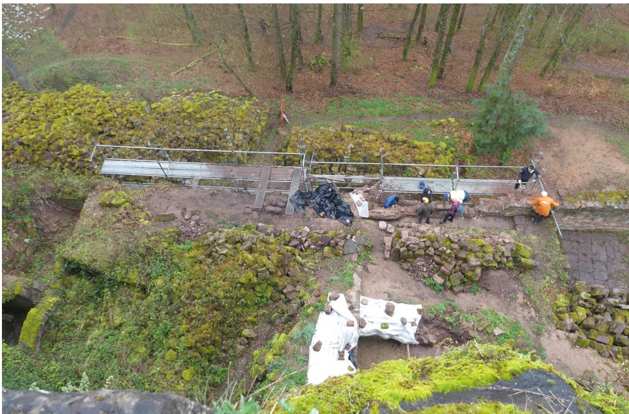
Ci-dessus : vue d'ensemble des chantiers de la courtine est et de la basse-cour est.