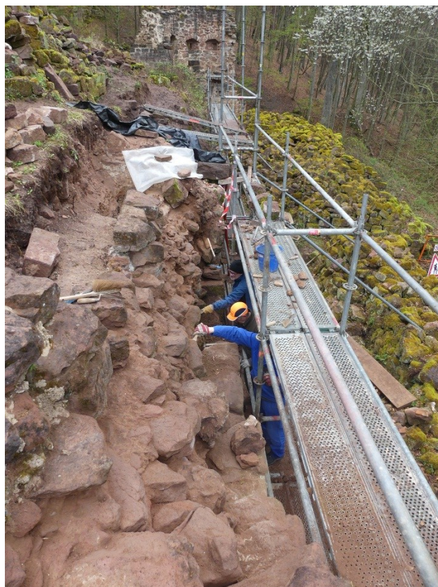
Nettoyage de la courtine.