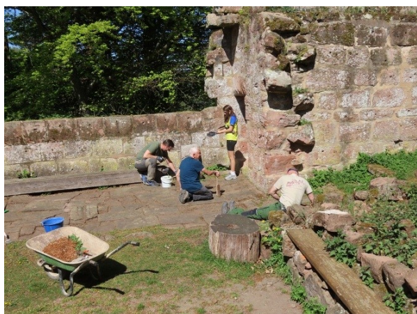
Désherbage des deux dallages à l'entrée.