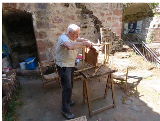
Réparation du mobilier.