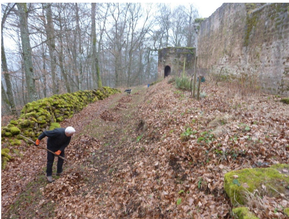
Evacuation des feuilles mortes le long du rempart est.

Le mois de janvier ne fut pas très propice au travail à cause d'une météo rigoureuse et à deux samedis réservés pour la chasse. Deux secteurs ont tout de même été débroussaillés ; le long du rempart est et la basse-cour ouest.