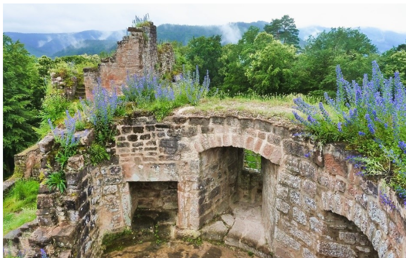
Toujours autour d'une bonne tablée et de belles plantes.