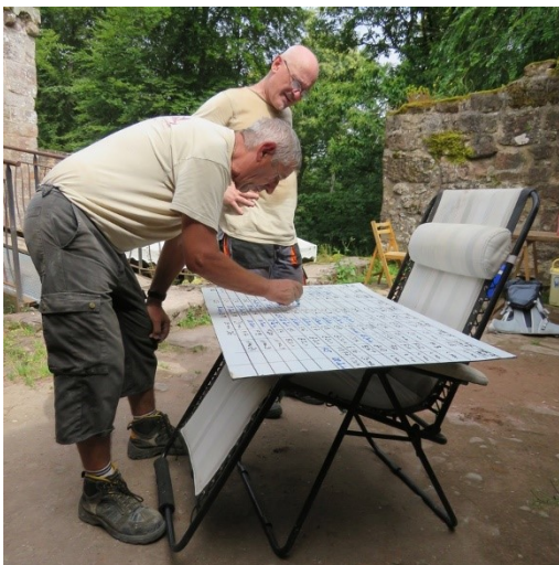
Inscription des blocs posés dans la journée.