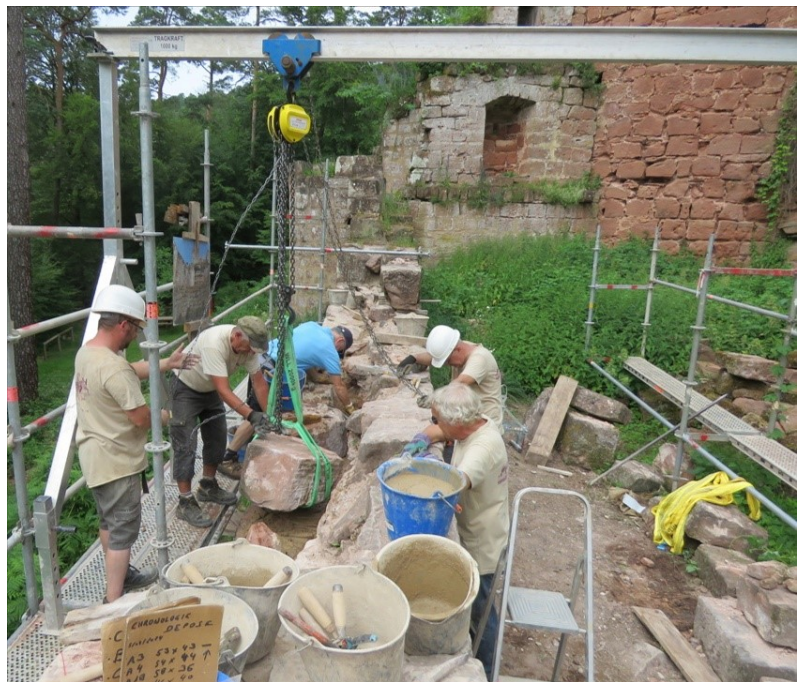
Nouveau palan et deux paires de nouvelles sangles.