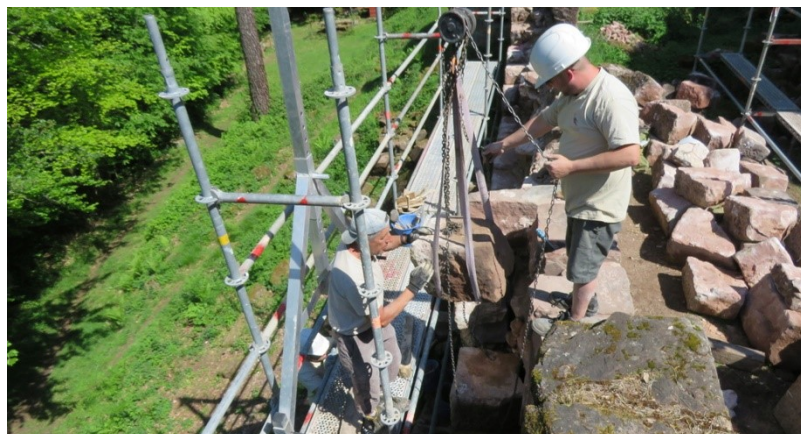
... puis remontage précautionneux des éléments, un par un.