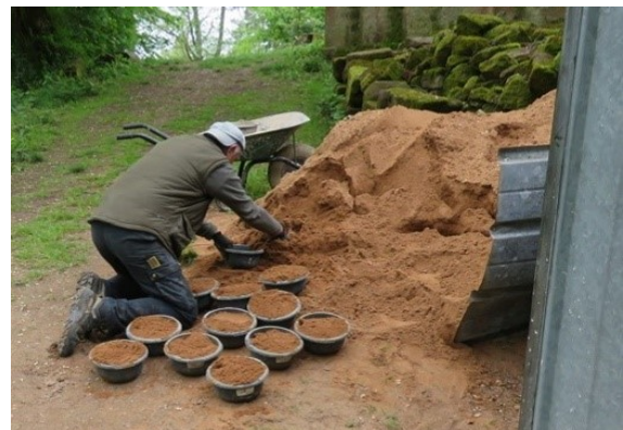
Mortier à l'ancienne pendant la réparation de la bétonnière.