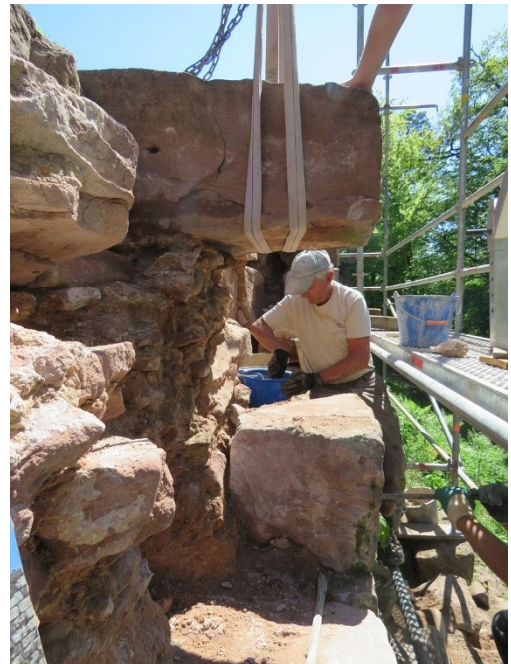
Dépose des deux blocs sous la boutisse...