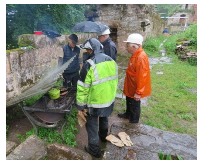
Des bénévoles toujours motivés pour un barbecue, même sous la pluie.