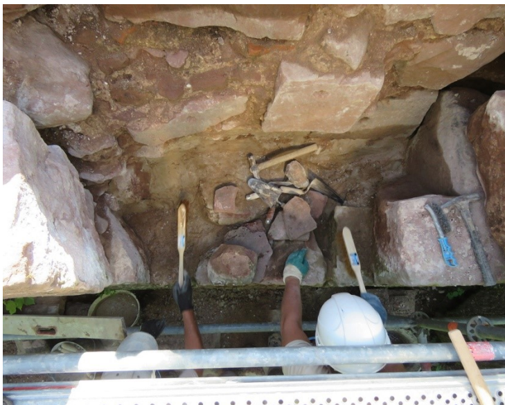
Préparation du mur pour la pose.