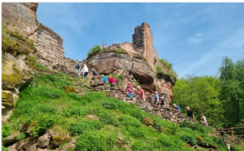
Le Club vosgien de Wissembourg a fait étape au château du Schoeneck ce 1 er mai.