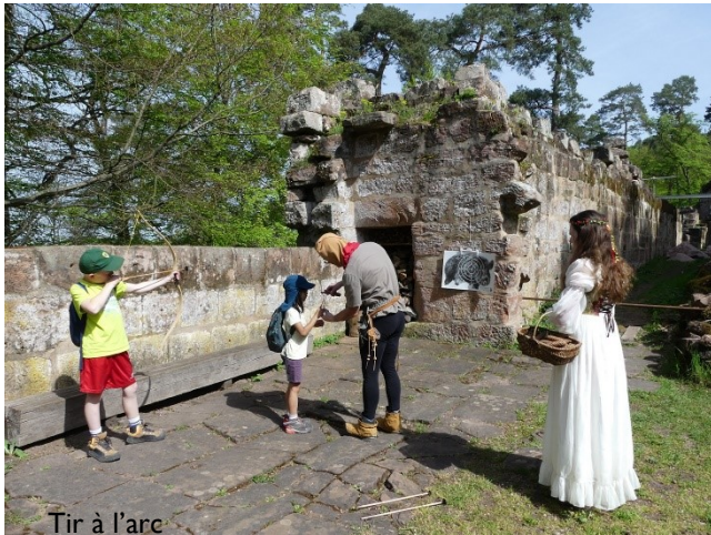
Tir à l'arc